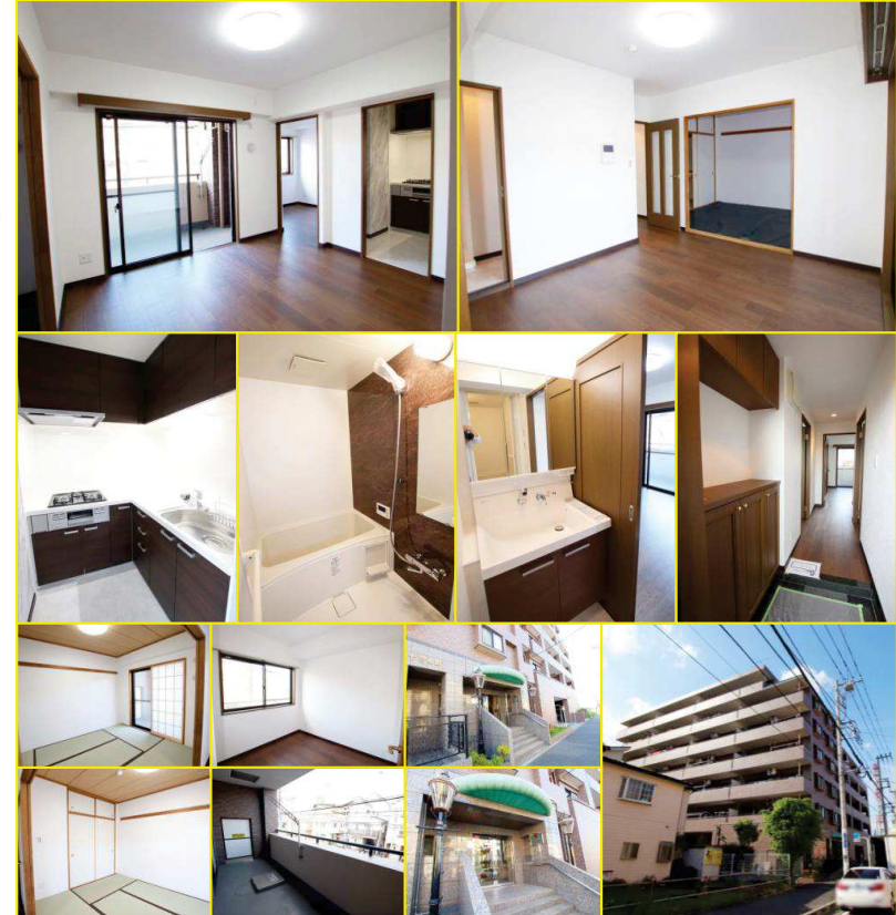
※図面と現況が異なる場合は現況優先とさせていただきます。

2階 205号室 ◆専有面積 56.95㎡（約17.22坪） ◆バルコニー面積 11.40㎡（約3.45坪） ◆価格 1,890 万円